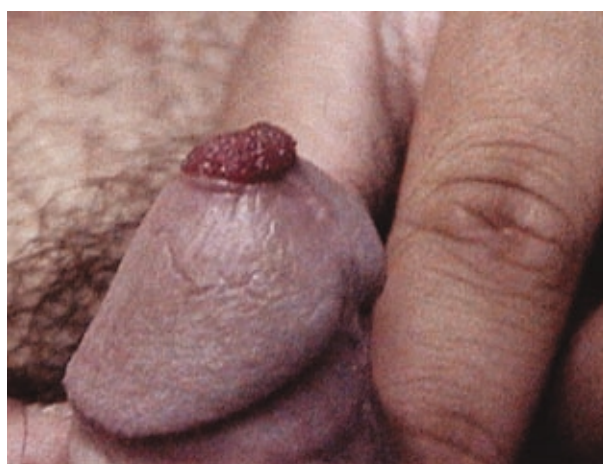
Figura 2. Condilomas en prepucio e intrauretral.