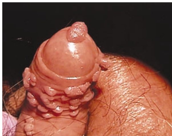
Figura 1. Condilomas acuminados en pene y meato uretral.

Las causadas por virus del papiloma humano son las infecciones virales de transmisión sexual más frecuentes. En estudios realizados en adultos sexualmente activos, se ha encontrado que de 50 a 75 % de ellos tienen anticuerpos positivos al contacto con el virus, y que alrededor del 15 % tiene infección asintomática. 2 Los condilomas intrauretrales constituyen un reto terapéutico para el urólogo (figura 1). De hecho, hasta ahora, las sociedades urológicas especializadas no han editado guías para el tratamiento de la infección por VPH en esta localización. 3 Los tratamientos más utilizados en estos casos son: aplicación de 5-fluorouracilo (5-FU), resección quirúrgica, electrofulguración, aplicación de láser o alguna combinación de estas técnicas. A continuación se presenta el caso de un varón portador del VPH intrauretral, tratado de forma exitosa con una combinación de aplicación intrauretral de imiquimod y crioterapia. Además se realizó una revisión bibliográfica acerca del tratamiento de infecciones por VPH en esta localización.