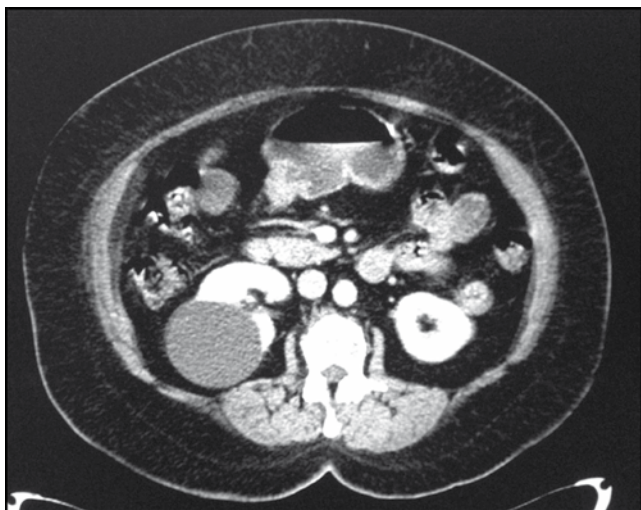
Figura 1 Tomografía abdominal contrastada. Se evidencia imagen hipodensa en cara dorsal de riñón derecho, sin reforzamiento con el medio de contraste.

La elección del paciente para asignarlos a cada grupo fue por conveniencia. Dependiendo de la localización del quiste (ya sea en la cara anterior o posterior del riñón), se divide en 2 grupos: